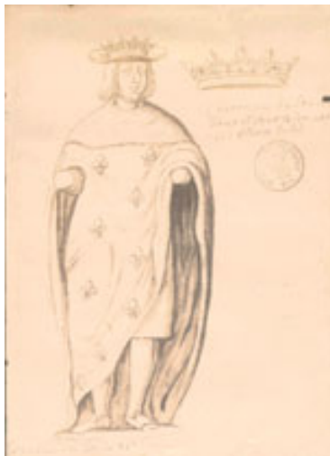
Certains auteurs ont supposé que la statue de roi qui se trouvait sur la façade occidentale représentait Louis XI, mais il s'agit en fait de saint Louis (Dessin ancien, Médiathèque Jean-Jeukens).