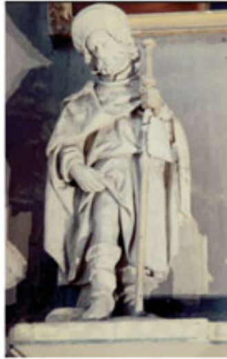
Conformément à l'iconographie traditionnelle, saint Roch, habituellement invoqué en temps de peste, montre le bubon de sa jambe