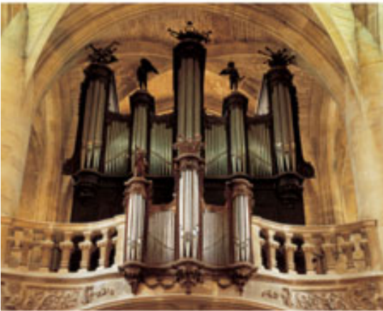
Orgue de la tribune

La présence d'orgues est attestée dans l'église dès le XVII e siècle. En 1770, Nicolas Dupont réalise un instrument, détruit 23 ans plus tard. L'instrument actuel est l'œuvre de Jean François Vautrin et de Antoine François Brice Didelot, il reprend des éléments de celui du XVIII e siècle et a été en partie modifié à la fin du XIX e siècle.