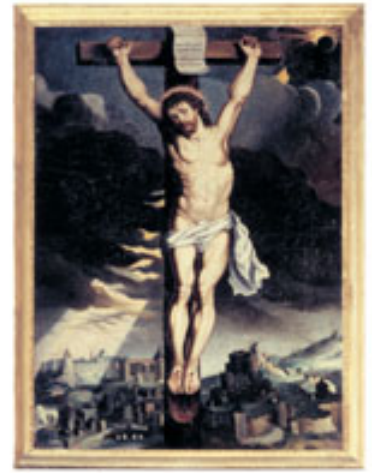
Anonyme, Crucifixion, huile sur toile, début du XVII e siècle