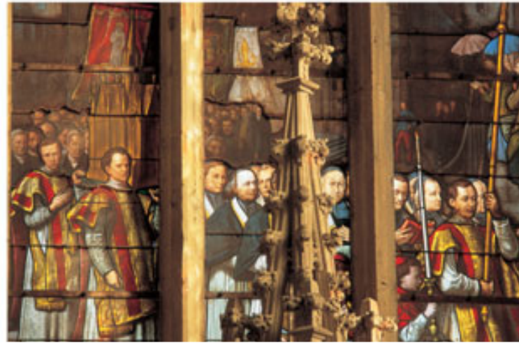
Vitrail de la translation des reliques de saint Maxe

En 1782, l'autre collégiale de la ville, Saint-Maxe, devint une église paroissiale. Celle-ci, avant sa destruction à la fin du XVIII e siècle, s'élevait à proximité du château ducal. On réunit les deux chapitres de Saint-Maxe et de Saint-Pierre dans cette dernière collégiale qui prit le nom de "Noble royale collégiale, Sainte-Chapelle, principale église et paroisse du Roy". Cette union eut notamment pour conséquence le transfert des reliques de saint Maxe, des dépouilles des ducs de Bar et de plusieurs monuments funéraires de l'église Saint-Maxe à l'église Saint-Pierre.