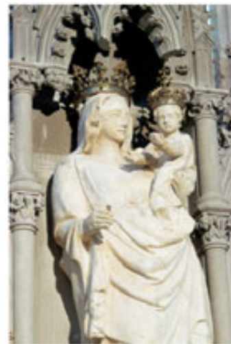
Notre-Dame du Guet fait encore aujourd'hui l'objet d'une fervente dévotion

A ses pieds sont aujourd'hui conservés les restes des ducs de Bar. Ils sont recouverts d'une large dalle de marbre noir, dernier vestige du tombeau du comte de Bar Henri IV et de sa femme Yolande de Flandre.