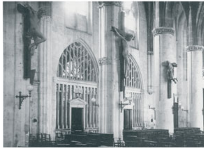
Cette vue ancienne du bas-côté sud laisse voir l'entrée des chapelles latérales et une ancienne disposition du Calvaire de Ligier Richier

A ses côtés, la chapelle des Fonts, fondée par la famille Baudinain au XVI e siècle présente un beau fronton ajouré aux motifs renaissants. La grille, un peu plus tardive, aurait été réalisée à la fin du XVI e siècle ou au début du XVII e siècle. L'un des vitraux conserve des médaillons en grisaille du XVI e siècle.