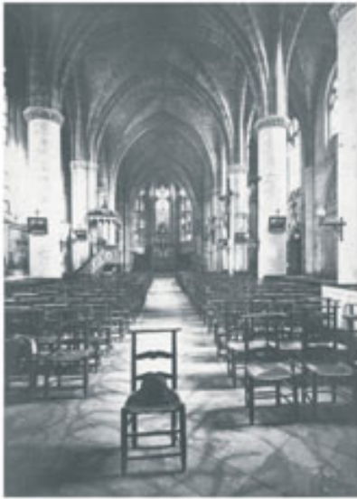
Cette vue de la nef aux alentours de 1900 est extraite du fonds de l'éminent érudit barisien, Léon Maxe-Werly