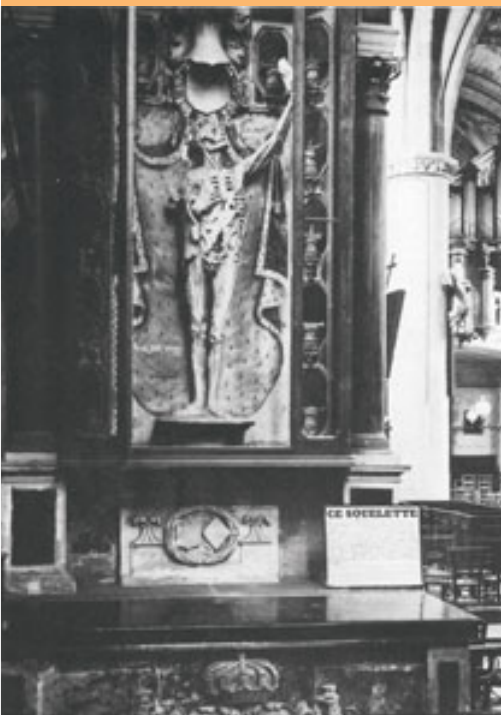
Le Monument au Cœur de René de Chalon est l'un des seuls vestiges des monuments funéraires qui ornaient la collégiale Saint-Maxe, détruite à la Révolution française