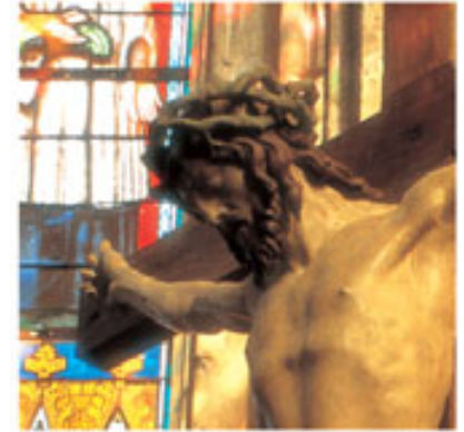
La douceur grave du visage du Christ du Calvaire, ainsi que le traitement bifide de la barbe sont typiques de l'art de Ligier Richier

Cette œuvre attribuée à Ligier Richier témoigne de la capacité de l'artiste à traduire les sentiments : remarquez le contraste entre l'attitude douce du Christ dont le corps élancé se situe encore dans la tradition du XV e siècle, celle, résignée, du Bon Larron – à gauche – et l'expression tourmentée du Mauvais Larron – à droite.