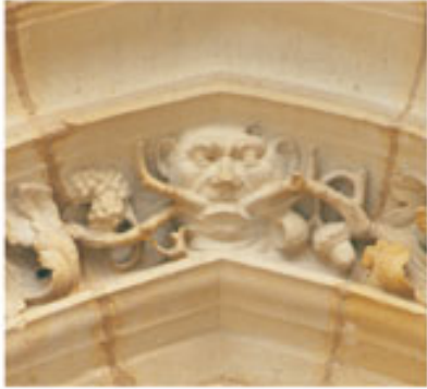
Le motif de la tête crachant des rinceaux de feuillages visible sur la façade occidentale est attesté depuis longtemps dans l'art médiéval

Longue de 43 mètres, large de 20 et haute de 12 mètres, l'église Saint-Etienne se présente aujourd'hui comme un édifice majeur de l'architecture de la fin du Moyen Âge en Lorraine.