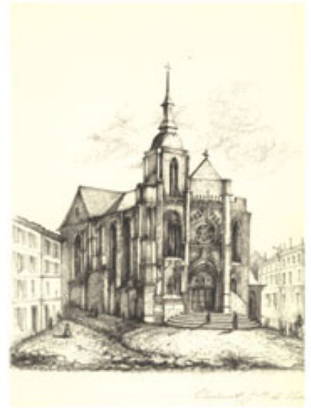
La façade occidentale de l'église a inspiré beaucoup d'artistes comme la comtesse de Vesins, dont est ici reproduit un dessin

Vers 1470, la partie orientale de l'église était sans doute achevée. Puis, pendant l'occupation du Barrois par Louis XI, entre 1480 et 1484, les travaux furent de nouveaux interrompus. Ils ne reprirent qu'après l'évacuation des troupes françaises et le rattachement du duché aux possessions du jeune duc de Lorraine, René II, duc de Bar de 1484 à 1508. C'est vraisemblablement de cette époque que date le voûtement de l'édifice. En effet, plusieurs clefs de voûtes portent les armes de René II ou de Philippe de Gueldre son épouse.