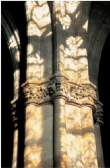
Les colonnes des deux dernières travées de la nef sont flanquées de colonnettes engagées et coiffées d'un chapiteau à feuillages selon une formule attestée au XIV e siècle

Située au cœur de la ville haute de Bar-le-Duc, la collégiale 1 , initialement dédiée à saint Pierre, fut fondée en 1315 par le comte Edouard I er . Elle succédait à une chapelle, sans doute construite au XIII e siècle, placée sous le même vocable où les notables de la ville haute se réunissaient auparavant pour prier. L'acte de fondation d'Edouard I er fut bientôt confirmé par l'évêque de Toul qui plaça la collégiale sous le patronage collectif de la Vierge, des apôtres Pierre et Paul et de saint Etienne. La construction commença peu de temps après.